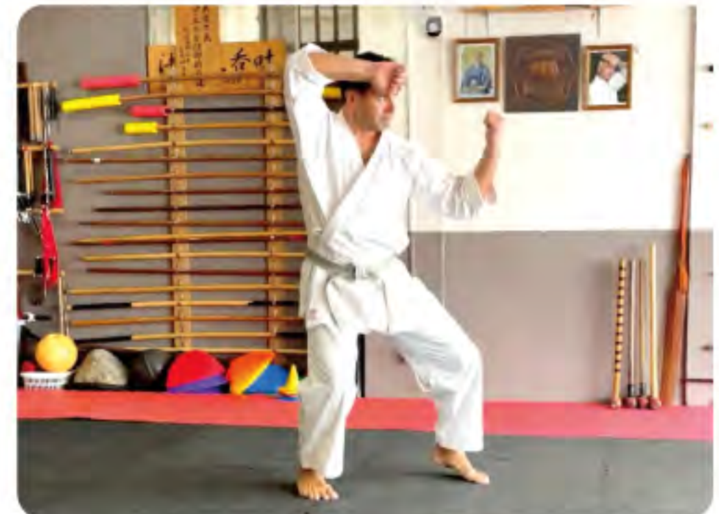
おきなわぶんかたいけん 沖縄文化体験