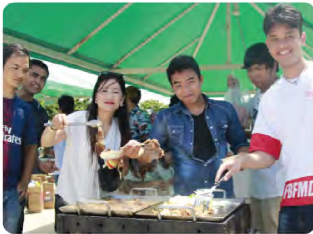
ビーチパーティー