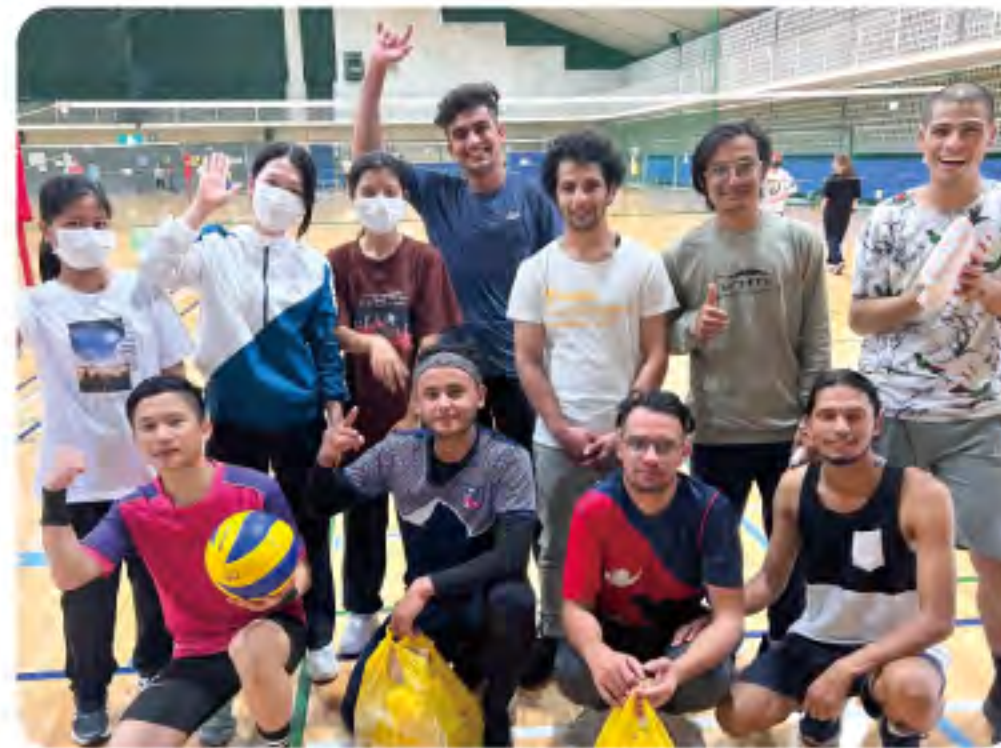
たいかい スポーツ大会