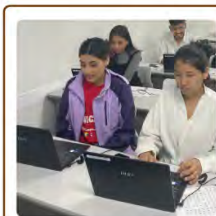
Web基礎の授業の様子

どのお仕事でも、パソコンを使う事が多くあります。私と一緒に、パソコンを使いこなせるように頑張りましょう！ 基礎からしっかり学びますので、初心者でも安心です。