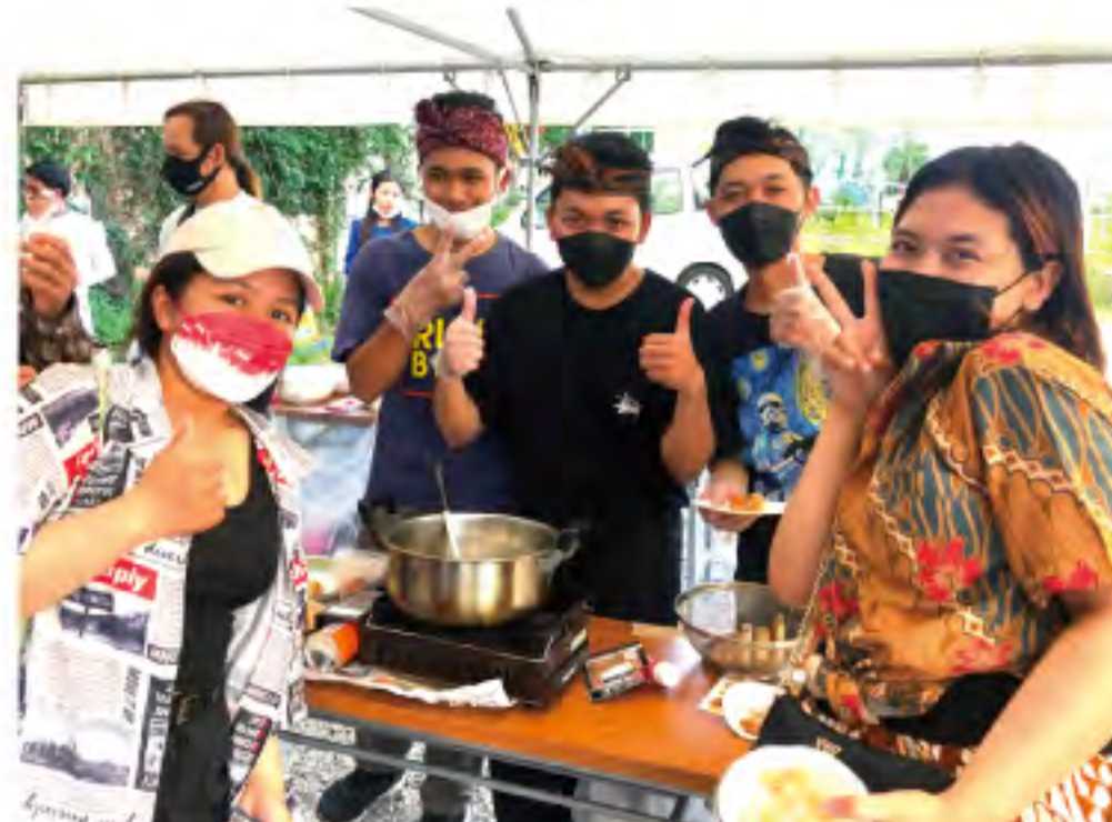
がくえんさい ガイカレまつり (学園祭)