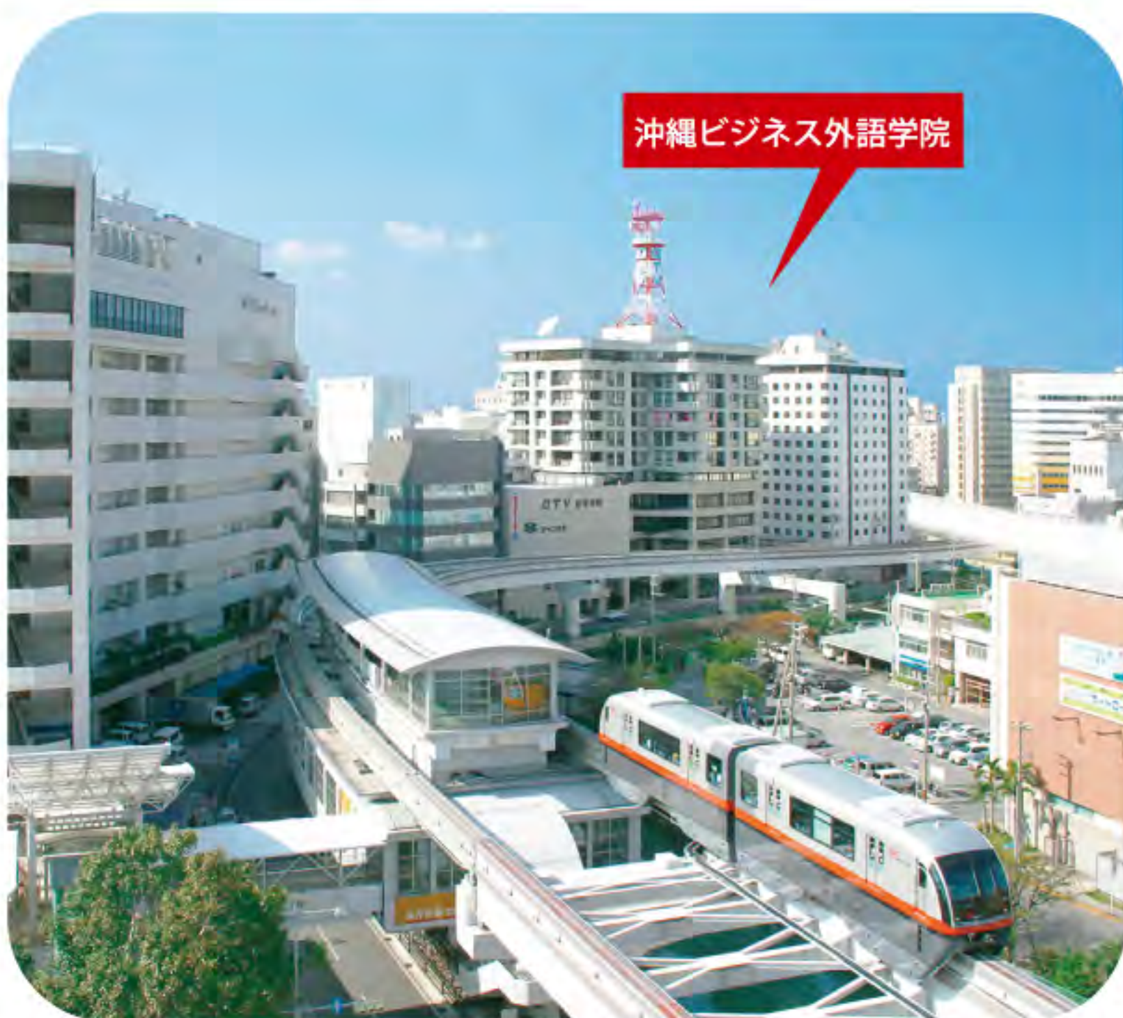
沖縄ビジネス外語学院