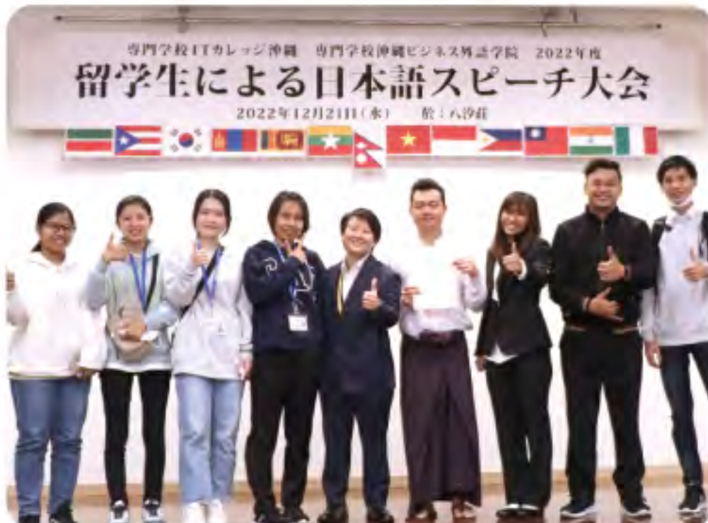
たいかい スピーチ大会